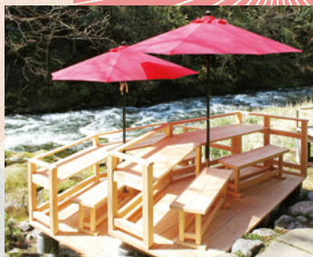
お座敷だけでなく、ペアシートもあります。